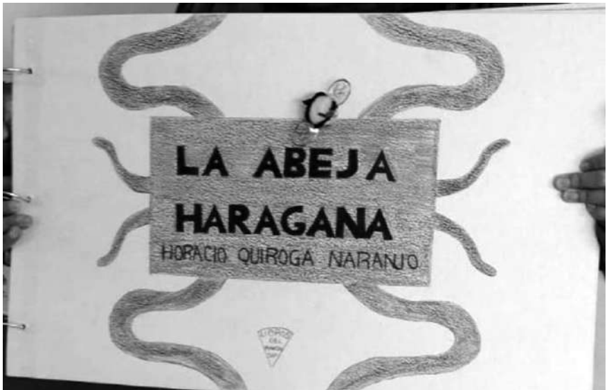
Libro gigante de "La Abeja Haragana" de Horacio Quiroga en Oztolotepec.

Posteriormente lo llevaron al aula para exponerlo ante sus compañeros y compartirlo, rotamos los libros para que todos pudieran leerlos de manera particular dentro del grupo y después los compartieron con sus compañeros del resto de la institución.