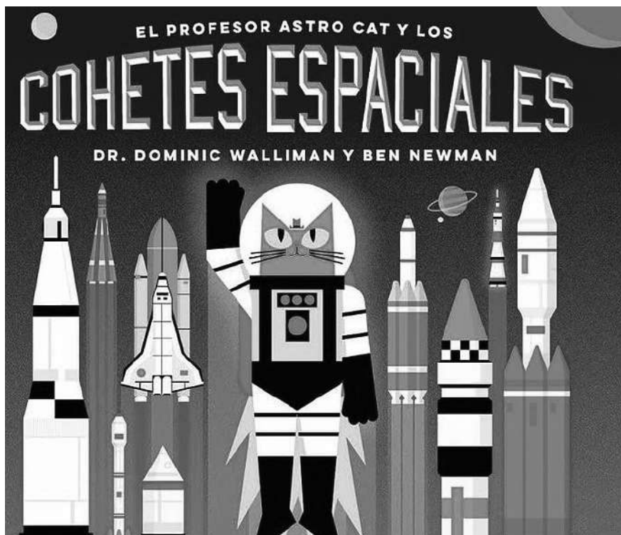
El Profesor Astro Cat y los cohetes espaciales es parte de la Colección Biblioteca SEP Centenaria