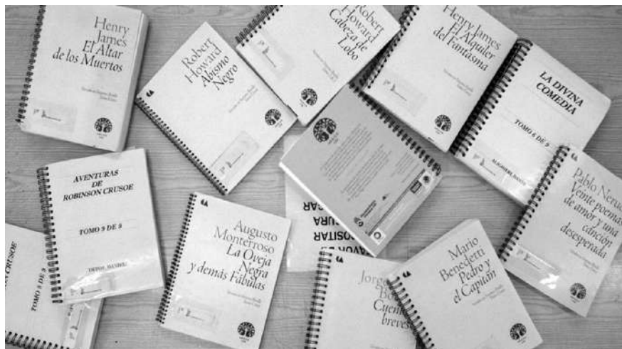
Colección México Lee en Braille

Asimismo, en línea podemos encontrar varios recursos, la Dirección General de Bibliotecas pone a disposición su colección infantil en el siguiente enlace: