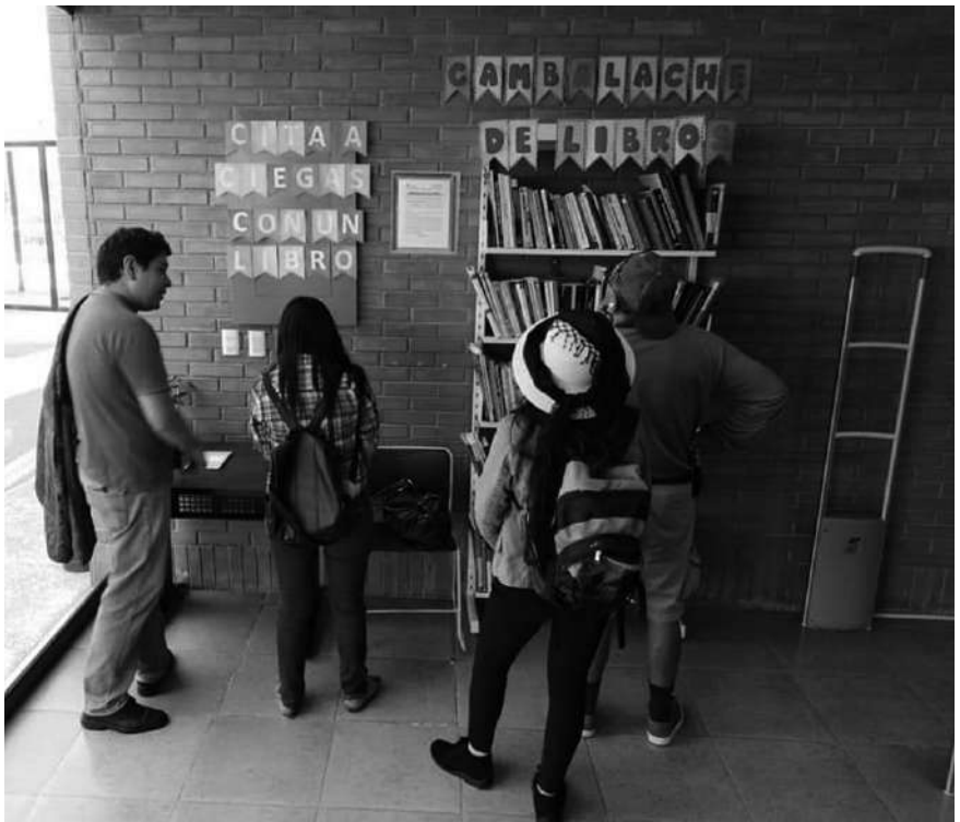
Cita a ciegas con un libro y Cambalache de libros, en la Biblioteca Pública Centenario de la Revolución.