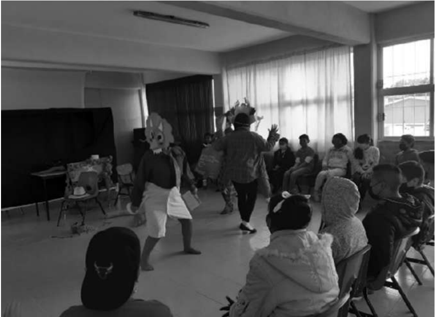
Juglares bibliotecarios en acción en el Estado de México.

El objetivo principal es incentivar a la población para que haga uso de los servicios que se ofertan en las bibliotecas públicas municipales de forma gratuita: consulta interna, trámite de credencial, visitas guiadas, préstamo a domicilio y módulo digital, además de concretar acuerdos con las instituciones educativas, para que se permita realizar sesiones de trabajo en sus instalaciones, por parte del bibliotecario, así como visitas de la matrícula estudiantil a la biblioteca.